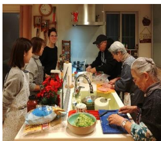
大人の cooking class