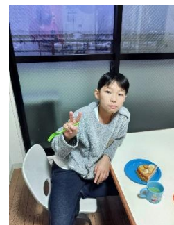
12月の Birthday boys! 英検頑張ってます！