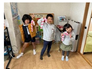
Craft Class Candy Cane